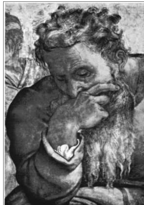
„Der weinende Prophet“

Michelangelo di Lodovico Buonarroti Simoni; 1475-1564; Ausschnitt aus den Deckenfresken der Sixtinischen Kapelle des Apostolischen Palastes im Vatikan